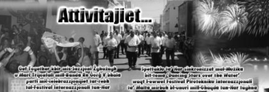
Get Together kbir, mis-Sazzjoni Żgħira u Mari Trijontali mill-Banda Re Gorg V b'ha parti mill-telebrazzjonijiet tar-reb tal-Festival Internazzjonali tan-Nar