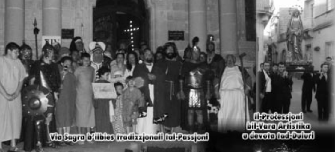
Via Sagra b'libbies tradizzjonali tal-Passjoni