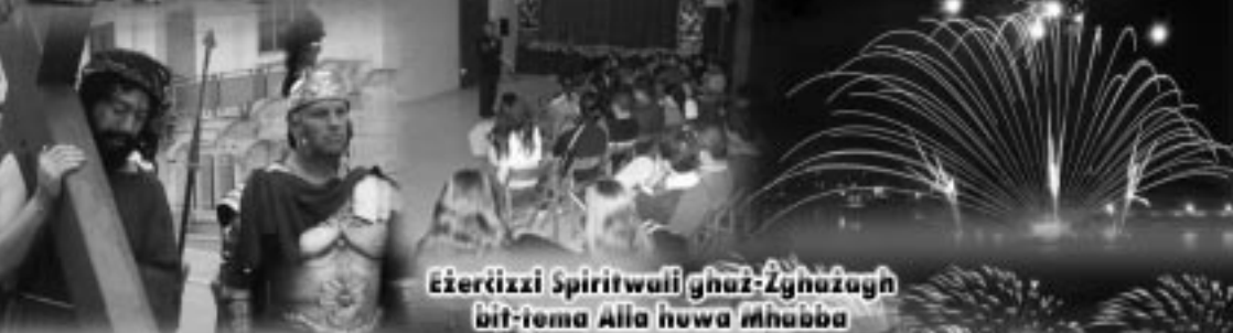
Eżerizzi Spiritwali għaż-Żgħira bit-tema Alla huwa Mhabbha