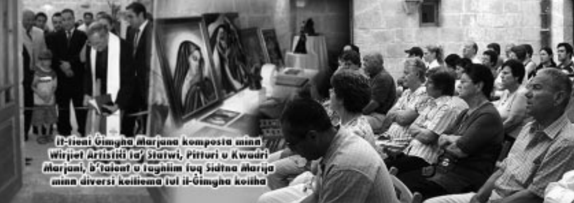
It-tieni Ġimgħa Marijana komposta minn Wirjiet Artistiki ta' Statwi, Pitturi u Kwadri Marijani, b'talent u taġnīm fuq Sidna Marija minn diversi kelliema tal-Ġimgħa kelliha