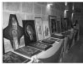
Il-Ftuh Uffiċjali tal-Wirjiet Artistici