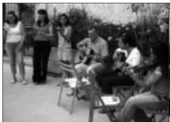
Il-Mother of Christ Folk Group