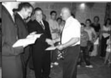
Is-Sibt: Prezentazzjonijiet tač-Ĉertifikati lill-partecipanti kollha waqt l-Għeluq tal-Ġimgħa Marjana