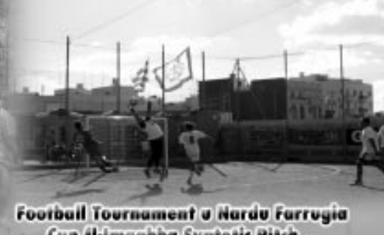
Football Tournament u Nardu Farroġia Cup fl-imqabba Synterik Pitch...