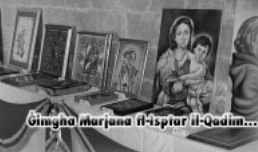
Ġimgħa Marjana fl-Isptar il-Qadim...