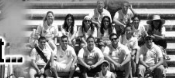
Skambjo Kulturall mill-Programm Youth ta' l-Unjoni Ewropea ma' l-ACLI ta' l-Italja...