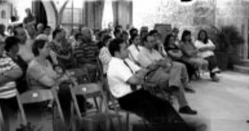
Ikla bejn il-hbieb, Ristorante Cosmana Navarra...